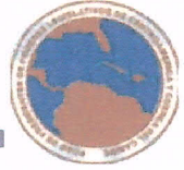
Ciro Cruz Zepeda Peña Presidente de la Asamblea Legislativa de la República de El Salvador y del FOPREL