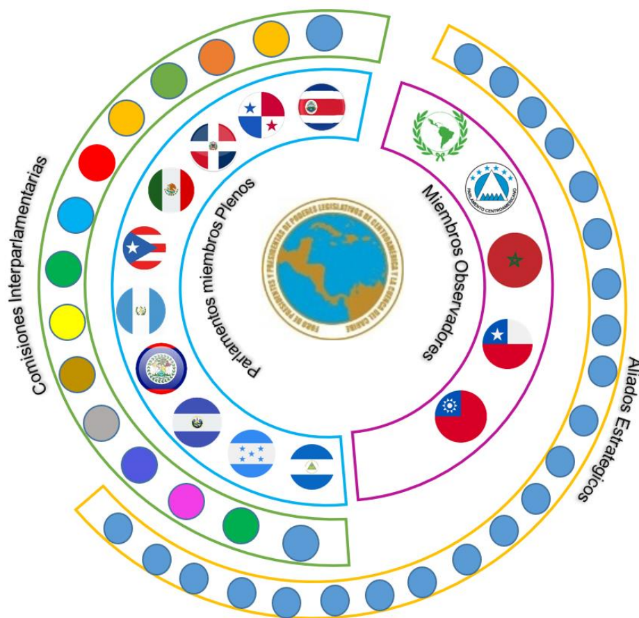
Gráfica 2. Dimensión regional y nacional del FOPREL

El FOPREL está integrado por 16 poderes legislativos, lo que representa 16 presidentes y presidentas parlamentarios miembros del Foro, de los cuales 10 son miembros plenos y 6 miembros observadores; cuenta con 2 instancias interparlamentarias (PARLATINO y PARLACEN) como miembros observadores; dicha estructura le permite tener representación en Centroamérica, Cuenca del Caribe, México, América del Sur (Chile y Ecuador), África (Reino de Marruecos) y Asia (República de China-Taiwán).